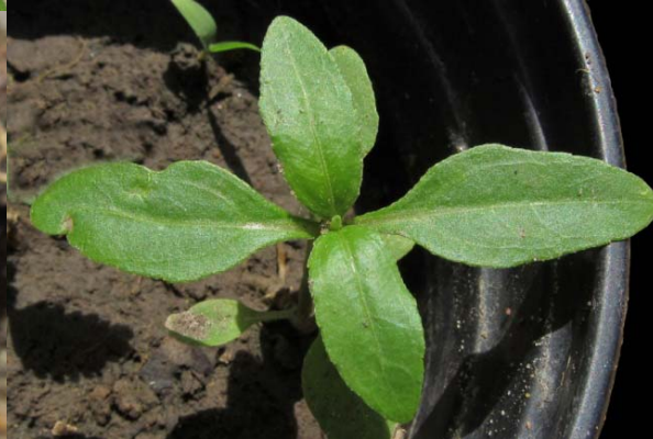
Estado de 6 hojas