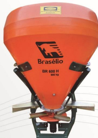
Cód. 13900 BR 600 H 900 kg

Características: Monodisco; Reservatório rotomoldado; Agitador excêntrico; Fundo dosador em inox; Túnel defletor; Chassi tubo curvado.