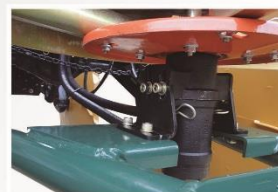
Acionamento do disco hidráulico