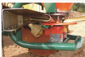
Acionamento do disco mecânico