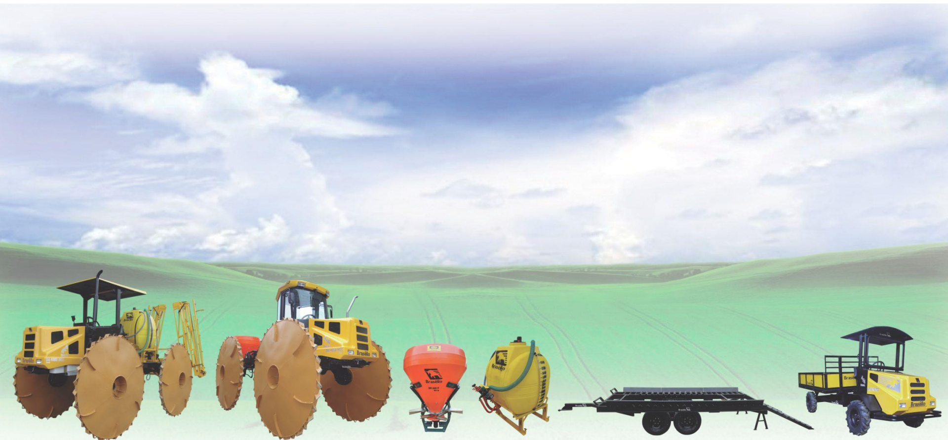
Trator - Semeador - Pulverizador - Carretão - Transportador