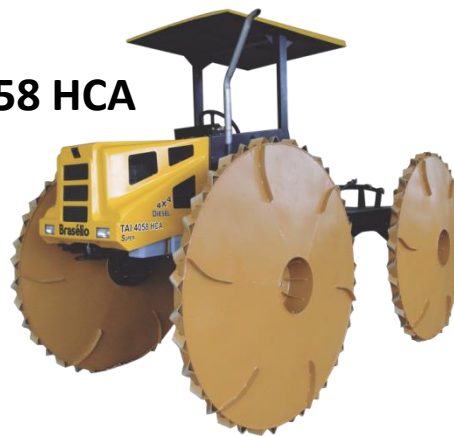
TAI 4058 HCA