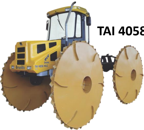
TAI 4058 HLC