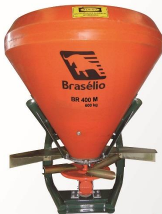
Cód. 13800 BR 400 M 600 kg

A empresa reserva-se no direito de alterar qualquer característica do produto sem prévio aviso.