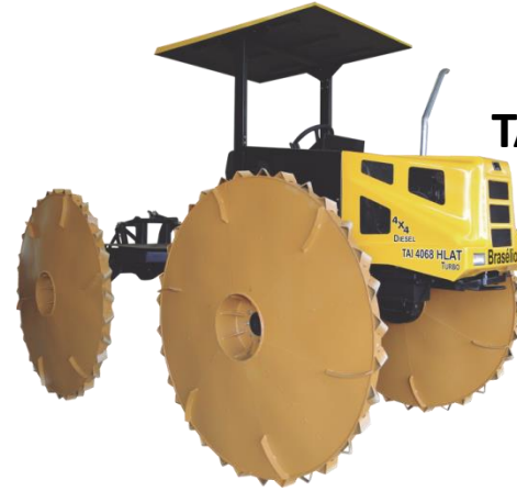
TAI 4068 HLAT