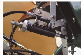
Abre/Fecha (dosador) hidráulico