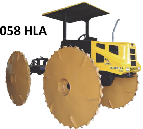
TAI 4058 HLA