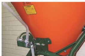
Abre/Fecha (dosador) manual