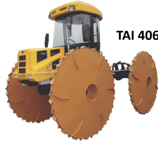
TAI 4068 HLCT