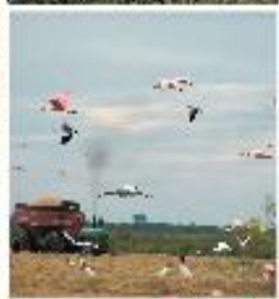
Serie Nº 1